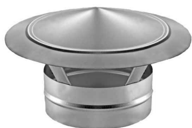
Исполнение №1 — ниппельное соединение